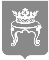
ГРАФИК приема граждан депутатами Тверской городской Думы в октябре 2023 года